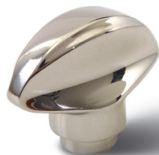
Фиг. 1105.52 – с диаметър на цилиндъра 15 mm. 1105.51 – с диаметър на цилиндъра 15 mm. 1105.53 – с диаметър на цилиндъра 15 mm. 1105.54 – с диаметър на цилиндъра 15 mm. 1105.55 – с диаметър на цилиндъра 15 mm.